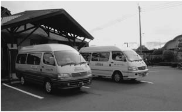
▲ 予約制の乗り合いタクシー「えびすふれあい号」

「秋の全国交通安全運動」 出発式 九月十八日（金）、秋の全国交通安全運動に伴う四町村合同（水上村・湯前町・あさぎり町・多良木町）による出発式が、本町えびす広場で実施されました。 これは、多良木地区交通安全協会と多良木警察署管内四町村役場が主催したもので、九月二十一日から三十日までの同運動期間中に行う、街頭広報活動に先立ち行われました。 出発式では、免田中学校吹奏楽部の演奏や、黒肥地・光台寺保育園の園児による交通安全宣言などが行われました。