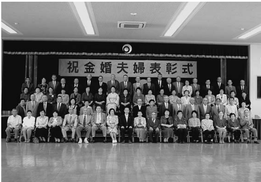
▲ 9月10日多目的研修センターで行われた金婚夫婦表彰式に出席されたみなさん

第五十一回熊本日日新聞社の金婚夫婦（結婚五十周年）巡回表彰が、九月十日（木）に多良木町多目的研修センターで研修室で行われました。