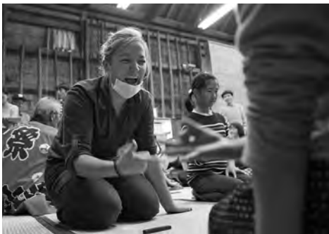
昨年の球磨拳世界大会の様子

人吉球磨地域外からも参加 がみられる球磨拳世界大会。 今年も球磨拳保存会の活躍に より盛大な盛り上がりを見せ そうです。今後行われる球磨 拳のイベントに参加してみま せんか。