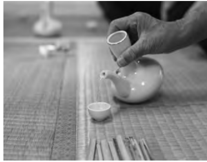
球磨焼酎の酒器 ガラとチョコ

記されています。このことか ら、球磨拳と焼酎は切っ も切れない関係にあること、 そして、お酒の場が盛り上が る一つの遊びであったことが うかがえます。