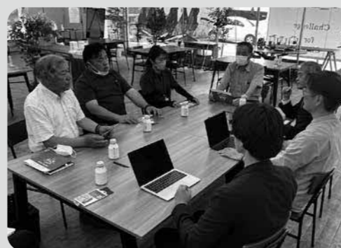
財団の現状と今後を協議

委員会所管の施設に、堆肥センターがある。経年による老朽化にともない、今後「補修・改修のため」多大な財政出動が必要となる。慢性的な職員不足もあり募集はしているものの改善には至っていない。そのため作業中の安全確保も心配される。しかし、本町の酪農・畜産家にとって必要な施設でもあり、今後どのような方向性をもって進めていくのか、執行部の早急な対応が求められる。当委員会では、今後、牛糞を肥料にすることにノウハウを持つ民間企業に移行する事も視野に入れてはとの意見があった。