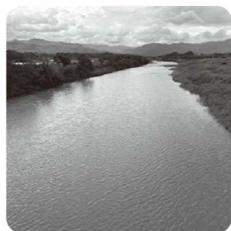
出水期に濁る球磨川

球磨川の濁りは市房ダムが原因ではなく、雨天時に山林災害等による被災地等からの土砂の流出が要因の一つと考えられる。関係市町村で県へ治山要望等を行い、山林からの土砂流出を減少できるように努力していきたい。