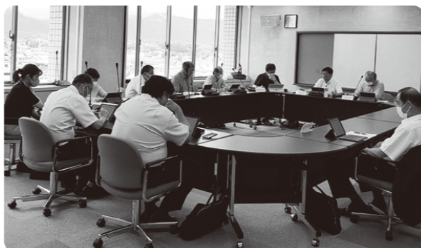
課題解決に向けて!

具体的には①議会内部の問題では「議会中継システム」や「議会の広報活動」・「報酬」等の問題。②町の「不採算施設」・「中学校跡地利用」・「多良木学園の民営化」・「たらぎ財団の今後」等の在り方。③町の課題としての「少子高齢化」等々の問題を優先順位をつけ任期中に時間をかけ議論していくこととした。