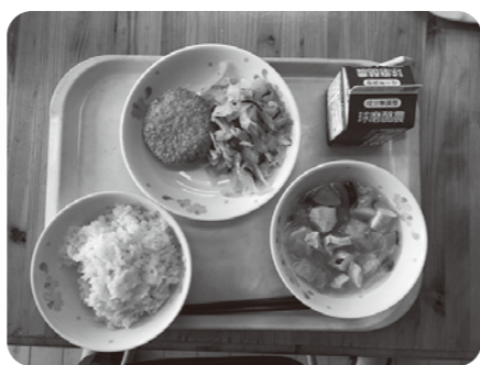
無償化される学校給食

将来、合併が政治日程に上がることも考えられるが、私が町長になってからは各町村間、国会・県会議員からも合併の話はない。合併後の役場の出先も将来、整理統合される懸念がある。国は合併を推進したいと思っていると考えるが、国・県が全町村に不利益とならない形で合併の条件を示さなければ着地点も考えられない。人吉球磨は一つにならなければならぬという気持ちは各町村長が持っていると思うが、どういう形で合併するかとなればなかなか難しい。