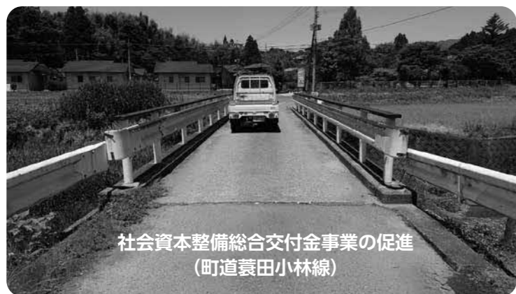
社会資本整備総合交付金事業の促進 (町道蓼田小林線)