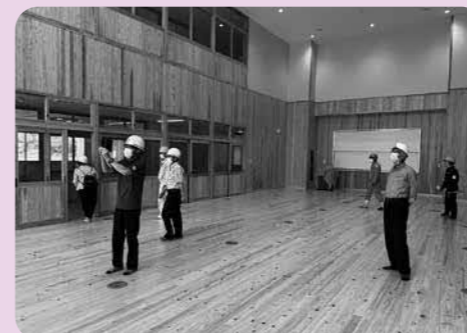
明るく広い多目的教室

1階の職員室や保健室、それに広々とした多目的広場には広い開口部からさんさんと降り注ぐ日光。2階に上がると明るく機能的に配置された教室、図書室、実習室それぞれの部屋の温度が空調でやさしく調整されている。校舎2階から完成したばかりの渡り廊下を行くと、旧多良木高校体育館をリニューアルし、複数の体育活動を同時に行うことのできる広々として明るい体育館。校舎北側の200mトラックを施したグラウンドは今にも生徒たちの走り回る姿を思い浮かべることができるまでに整備されている。