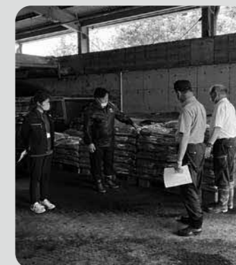
堆肥センター視察と肥料の説明

委員会所管の施設に、堆肥センターがある。経年による老朽化にともない、今後「補修・改修のため」多大な財政出動が必要となる。慢性的な職員不足もあり募集はしているものの改善には至っていない。そのため作業中の安全確保も心配される。しかし、本町の酪農・畜産家にとって必要な施設でもあり、今後どのような方向性をもって進めていくのか、執行部の早急な対応が求められる。当委員会では、今後、牛糞を肥料にすることにノウハウを持つ民間企業に移行する事も視野に入れてはとの意見があった。