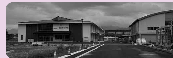
開校を待つ新校舎

そして最初に目に飛び込んだのが、運動会ができそうなほど校舎を一直線に貫いている100m近い廊下だ。