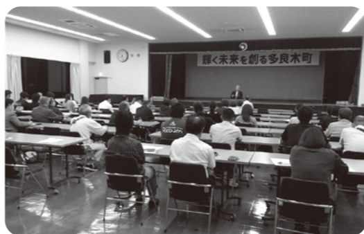
研修センターでの行政座談会