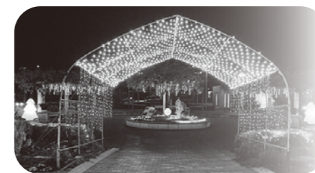
イルミネーションのイメージ図