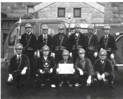
▲連合会の大会で優勝した1分団3部