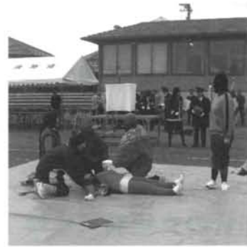
▲女性消防隊によるAED使用の実演