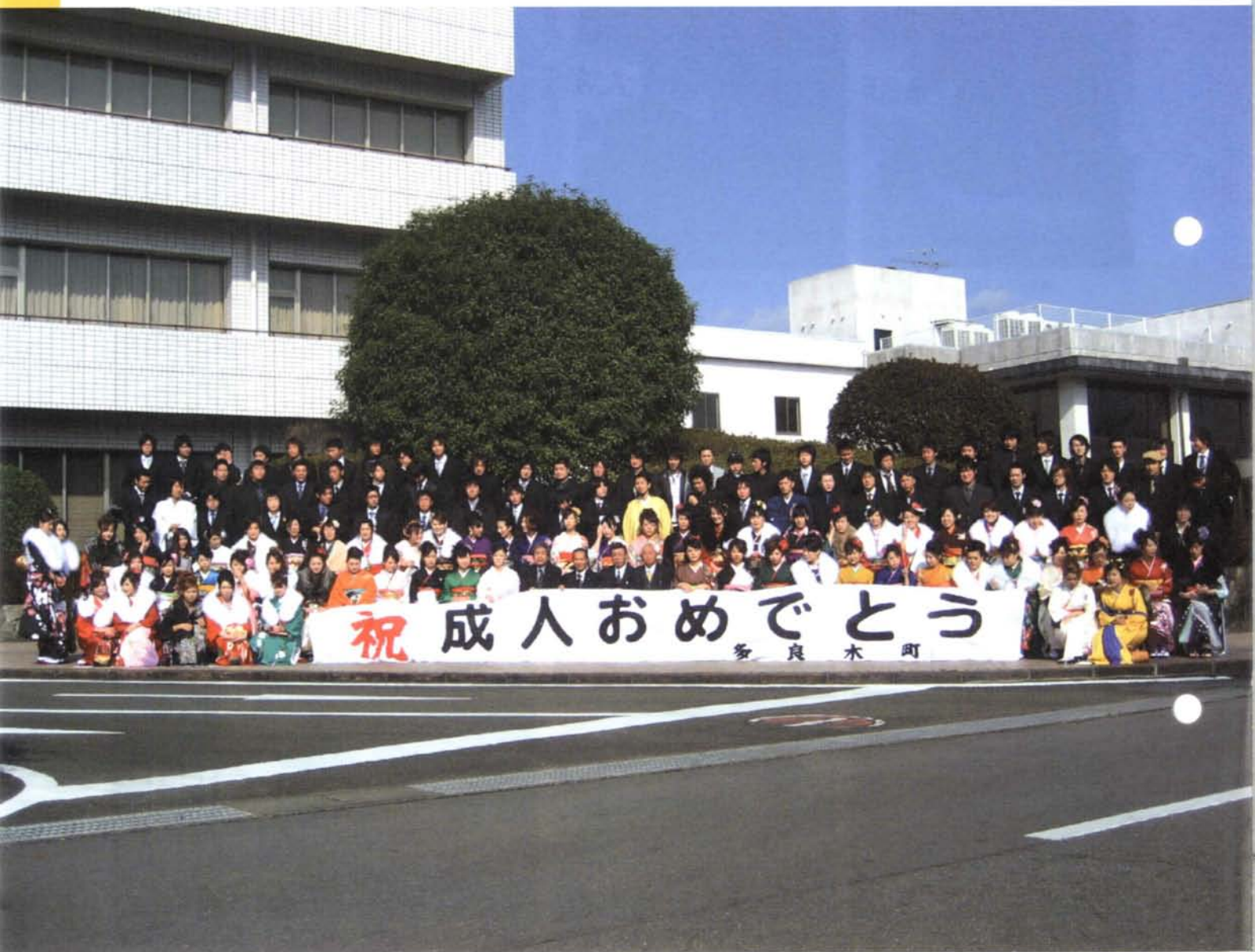
多良木町役場庁舎前で成人式の記念撮影