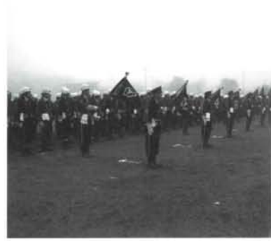
▲分列行進後に各分団ごとと整列した消防団