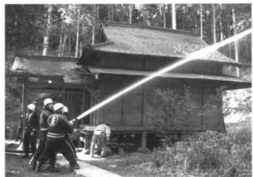
栖山観音堂境内での放水

1月26日は、法隆寺金堂壁画が焼損した日(昭和24年)に当たるので、この日を「文化財防火デー」と定め、この日を中心として文化財を火災、震災その他の災害から守るため、全国的に文化財防火運動を展開し、国民一般の文化財愛護に関する意識の高揚を目的とされています。