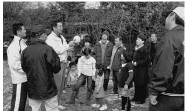
▲メロン収穫の説明を聞く参加者