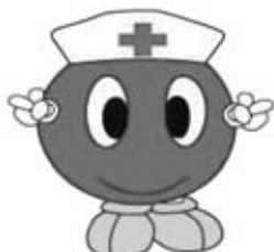
献血マスコット 「エピオ(A・B・O型)君」

このため、熊本県では1月～2月の2ヵ月間、成人式を迎える「はたち」の若者を中心に多くの県民の皆様に献血の呼びかけを行っています。