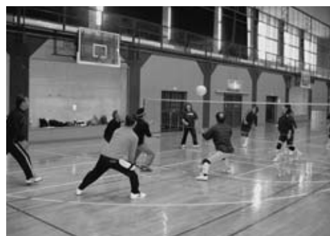
▲ビーチボールバレー会場