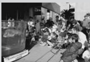
本物そっくりのお魚ロボット

当日は中学生の生徒が来客者へ実験を教える体験教室や、各種団体、高等学校、専門学校、大学による実験や機械の操作体験、ロボットによる競技がおこなわれ、遊びにきた子どもたちはロボットとのふれあいや実験に興味津々で、楽しい一日を過ごすことができました。