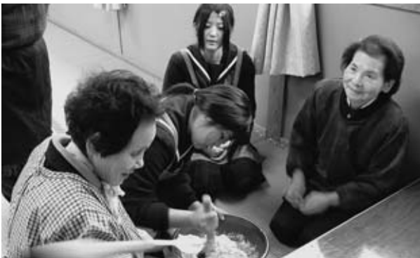
▲郷土料理づくりを体験する多良木高校生徒