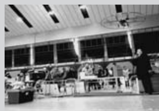
八個のプロペラで浮遊する飛行ロボット