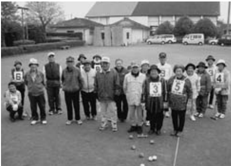
▲ゲートボール会場

また、別日程で一週前の二十二日(日)には、球磨カントリイ倶楽部でゴルフ競技(チャリティー)も行われており、毎年、参加者が六百名を超えるこの大会は、本町を代表する